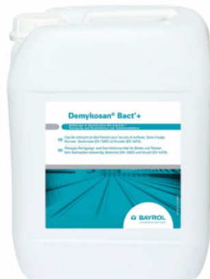
Bidon de Demykosan Bact +

Article disponible en : | Autres langues