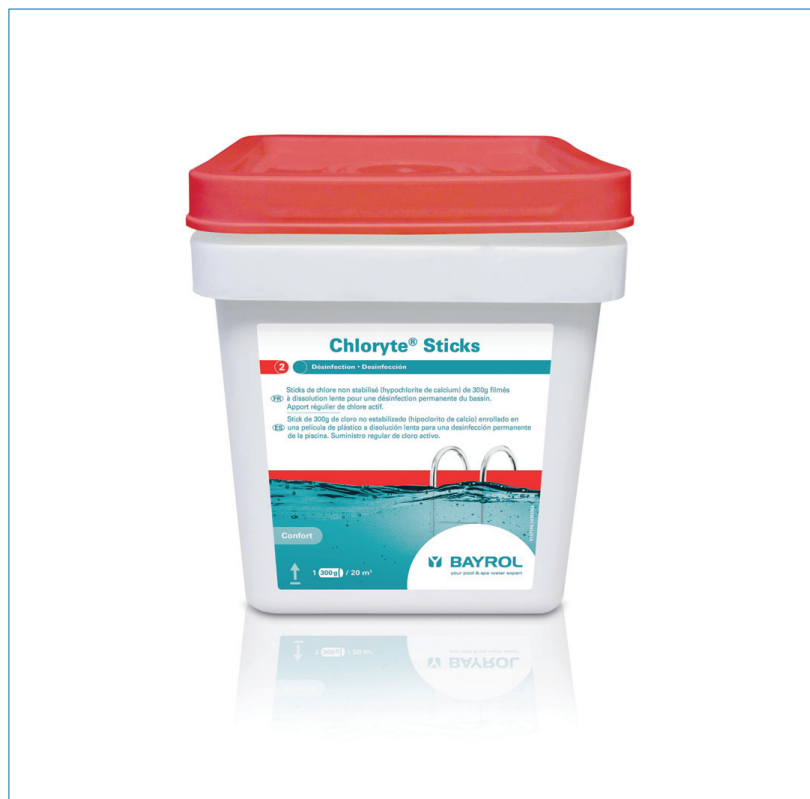
Chloryte® Sticks, traitement à base de chlore non stabilisé à dissolution lente Bayrol

Avec ou sans chlore, voici les principales solutions pour désinfecter, puis rendre désinfectante l'eau de votre piscine. Mais aussi une liste d'actions à mener pour faire face aux dix problèmes les plus courants concernant la qualité de l'eau.